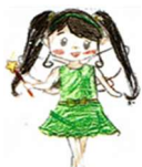
まちっこ通信キャラクター 「まちっこちゃん」

今年度は、性教育に関連した本を、どんぐりカフェ(施設内の職員のフリースペース)に置きました。ページに折り目がついているのを見つけると、「読んでもらえているんだな」と、うれしい気持ちになります。これからも性教育委員会では、性やいのちについて考えるきっかけや、安心して学べる場を大切にしながら、活動を続けていきたいと思っています。