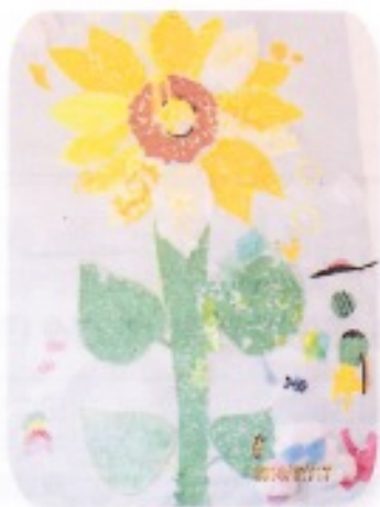
子どもたちの貼り絵