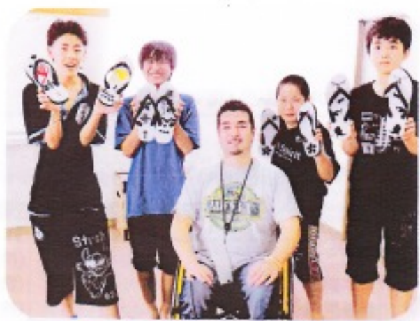
島ぞうり作り体験