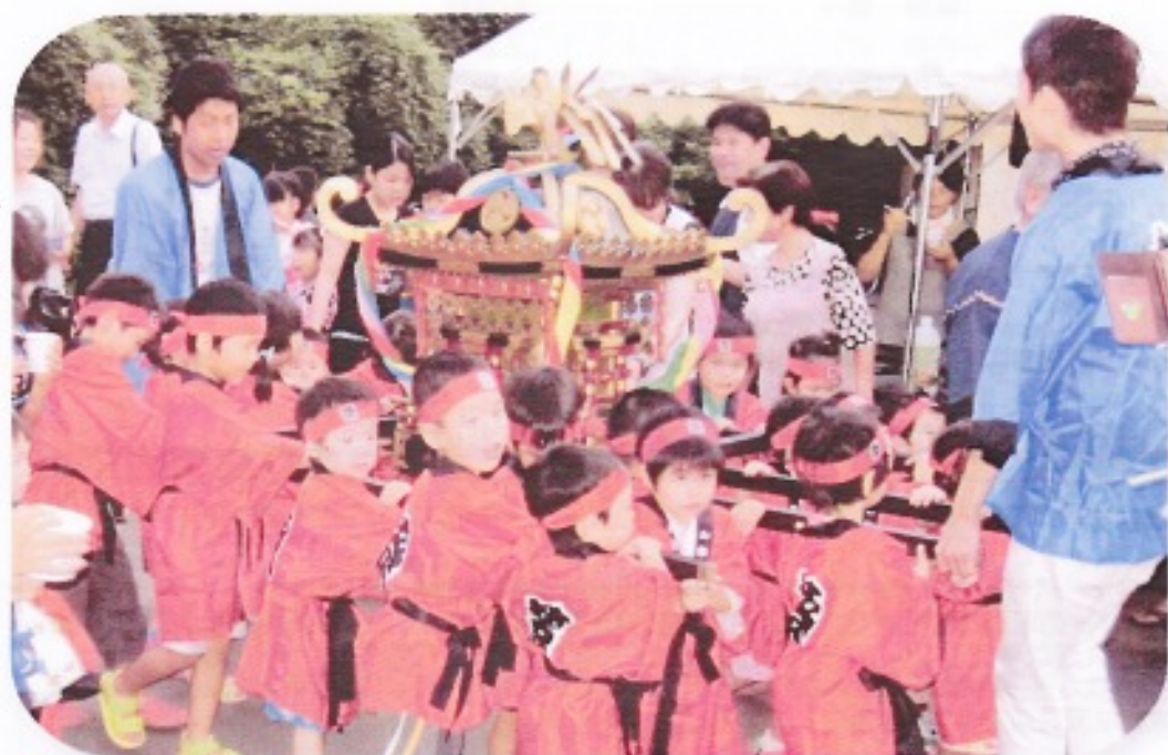
夏まつり・ちびっこおみこし