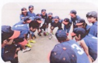
埼玉県親善球技大会